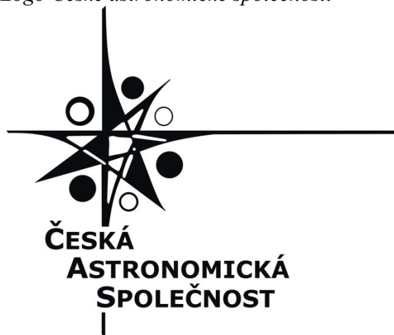
Logo České astronomické společnosti